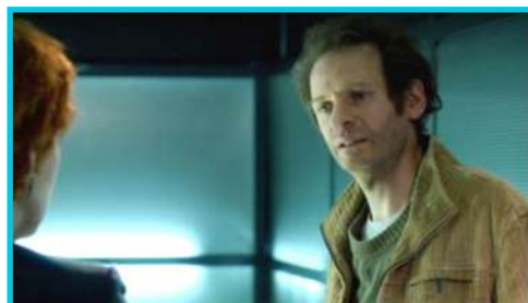
Julie Lescaut, TF1